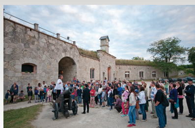
FortÉj - Múzeumok Éjszakája június 20.