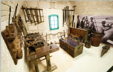
„Duna, hajók, mesterségek” kiállítás