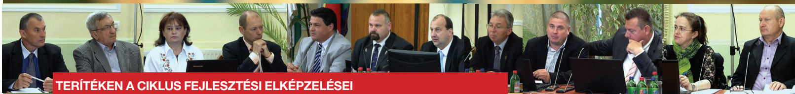
TERÍTÉKEN A CIKLUS FEJLESZTÉSI ELKÉPZELÉSEI