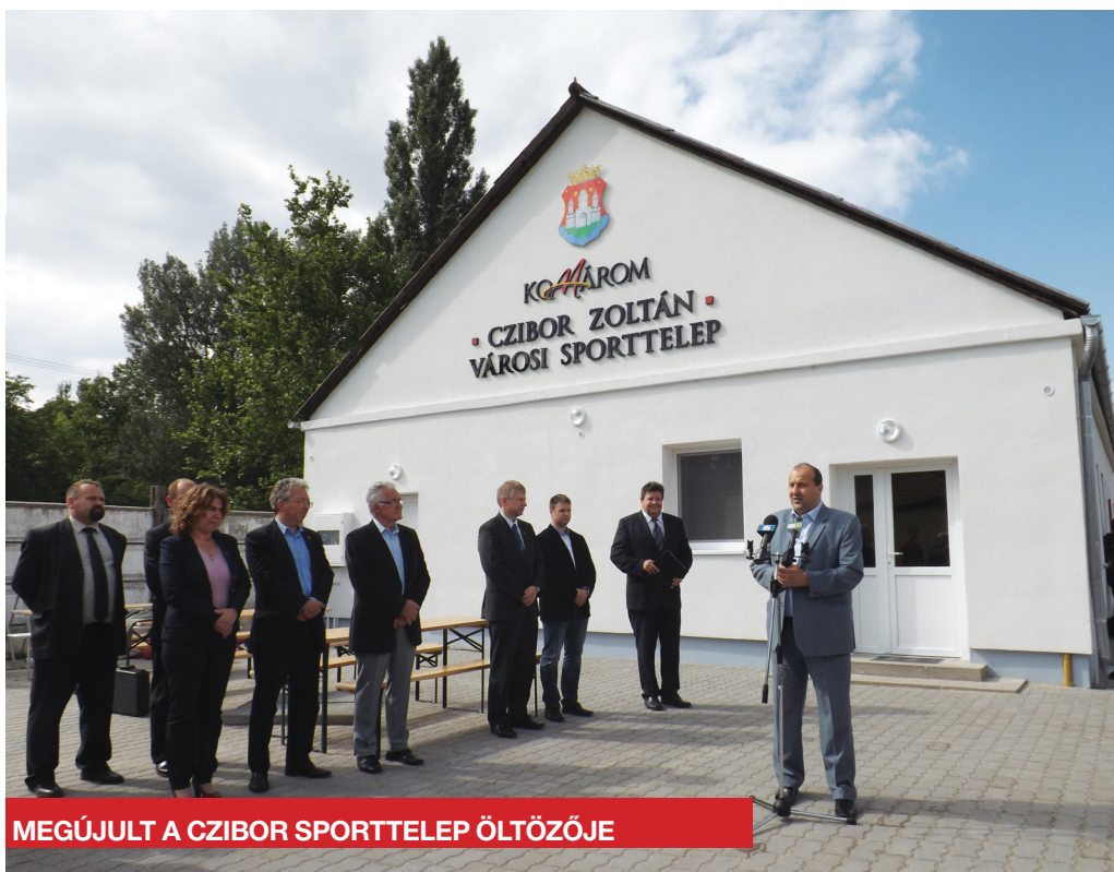
MEGÚJULT A CZIBOR SPORTTELEP ÖLTÖZŐJE