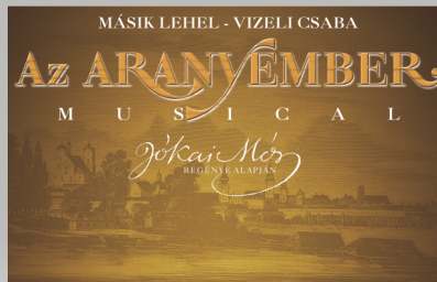
Jókai Hétvége, július 24-26.