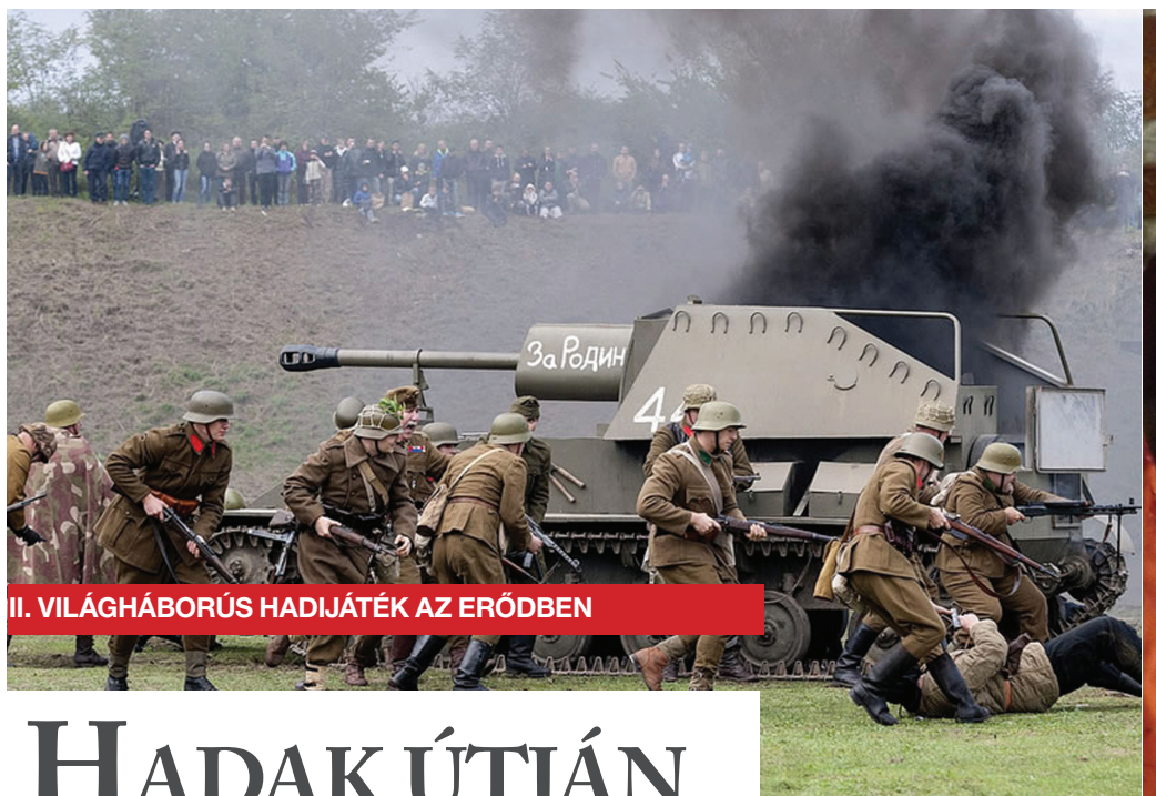
II. VILÁGHÁBORÚS HADIJÁTÉK AZ ERŐDBEN

Ma hazánkban minden második családban él kutya vagy macska. A programokat ezért úgy állították össze, hogy az az érdeklődők számára is vonzó legyen. Számos bemutatóval és egyéb érdekességgel készültek a szervezők.