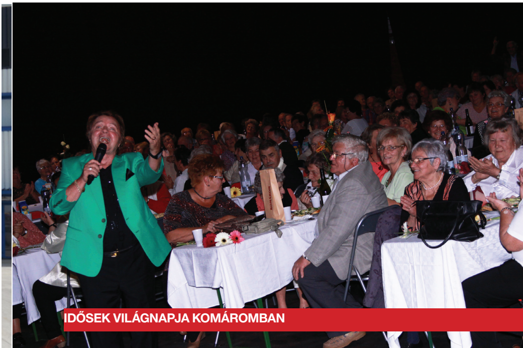
IDŐSEK VILÁGNAPJA KOMÁROMBAN