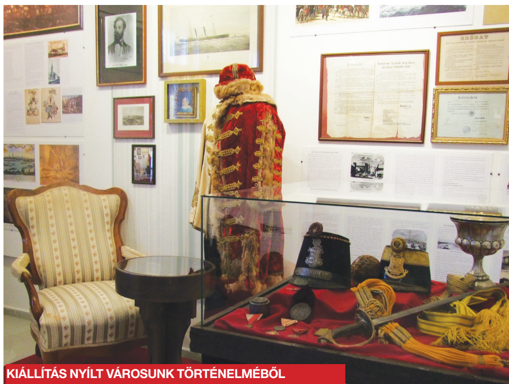
KIÁLLÍTÁS NYÍLT VÁROSUNK TÖRTÉNELMÉBŐL

Együttműködő partner: Magyar Tengerészek Egyesülete