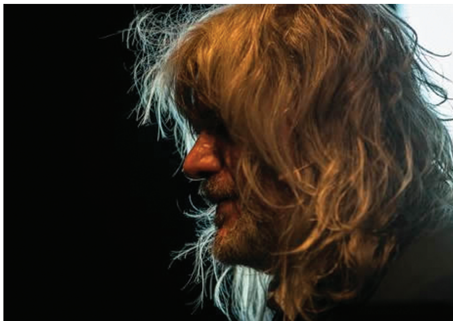
HOBO ELŐADÁS A MAGYAR KÖLTÉSZET NAPJÁN