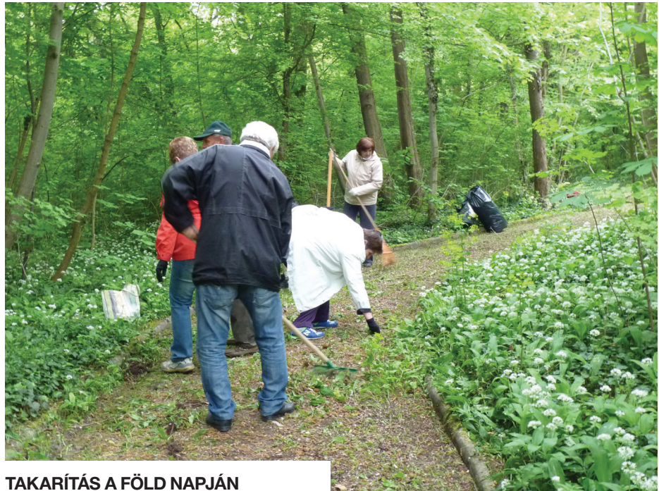
TAKARÍTÁS A FÖLD NAPJÁN

A TeSzedd! üzenete a következő: A szemét nem értékes, ha nem jó helyre kerül. A megfelelő módon gyűjtött hulladék viszont újrahasznosítható – nem szennyezi a környezetet és másodnyersanyag lesz belőle, így lassítható a Föld erőforrásainak kiaknázása. Ne dobáld szét a szemetet, hogy ne legyen az ország egy nagy szemétdomb! Mutass példát a felnőtteknek, tanítsd őket! Érezd otthon magad az utcán is, ne dobáld szét a szemetet!