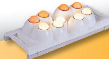
A CERAGEM MASTER-E készülékhez tartozó, valamint a COMPACT P390 -es készülék 9 és 3 fejes projektorai, infravörssel fűtött jádeköves fejek a moxázás, akupresszúra és masszázs alkalmazására szolgálnak

Az ügyfélközpontú kutatás-fejlesztéssel és a vásárlói tapasztalatra alapozott marketinggel a világpiac élén állunk.