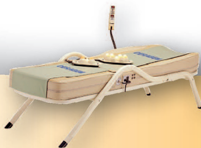
Ceragem-E automatikus termo-akupresszúrás gyógyászati készülék