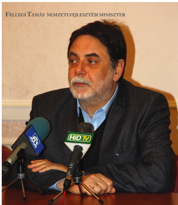
FELLEGI TAMÁS NEMZETI FEJLESZTÉSI MINISZTER

Dr. Molnár Attila polgármester az infrastrukturális fejlesztésekkel kapcsolatban kiemelte, hogy végre elérhető közelségbe került az új Duna-híd megépítése. Az új összekötő megépülése élénkebb gazdasági kapcsolatokat jelenthet majd nemcsak Szlovákiával, de az egész térséggel is.