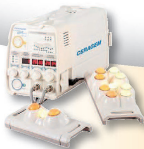
Ceragem Compact P390 kézi moxaakupresszúrás készülék