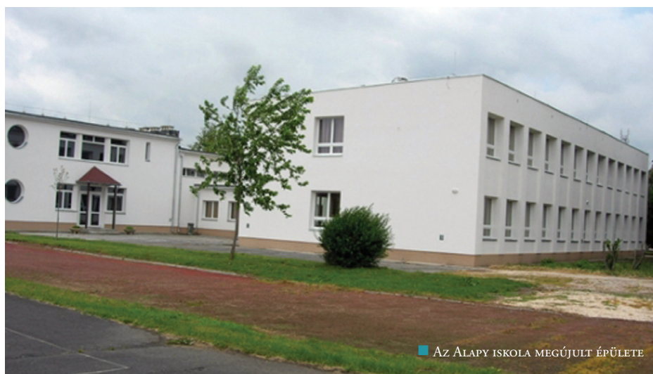
■ AZ ALAPY ISKOLA MEGÚJULT ÉPÜLETE

Már a második jelentős beruházást vitte sikerre a KEM Alapy Gáspár Szakiskola, Szakközépiskola és Kollégium az Új Széchenyi Terv segítségével. A pályázatot megyei szakképzés-szervezési társulás bonyolította le.