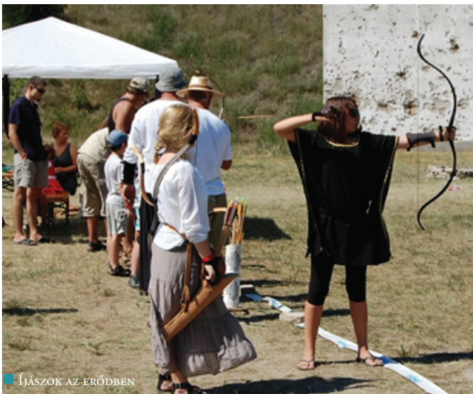
ÍJÁSZOK AZ ERŐDBEN

Az Erődváros Íjász egyesület harmadik alkalommal szervezte meg íjász- és jurttalálkozóját az Igmándi Erődben. Egész napos családi programokkal, lovaglási lehetőséggel, íjász- és ostorbemutatókkal, kézműves foglalkozásokkal és vásárral várták az érdeklődőket – mindezt természetesen a hagyományörzés jegyében.