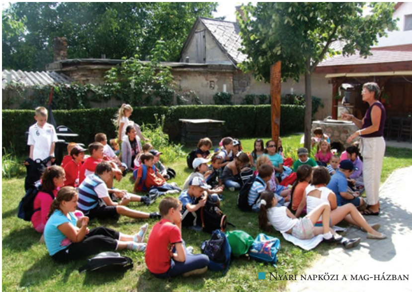
■ NYÁRI NAPKÖZI A MAG-HÁZBAN

Komárom Város Önkormányzata ebben az évben szakított a több éves hagyománnyal, s első alkalommal civil szervezettel kötött megállapodást a városban működő általános iskolások nyári napközis táborához. Nyáron a koppánmonostori városrészben lévő Mag-ház adott otthont kilenc héten át annak a 78 gyermeknek, akik hetente 31 és 45 csoportban jelentek meg.